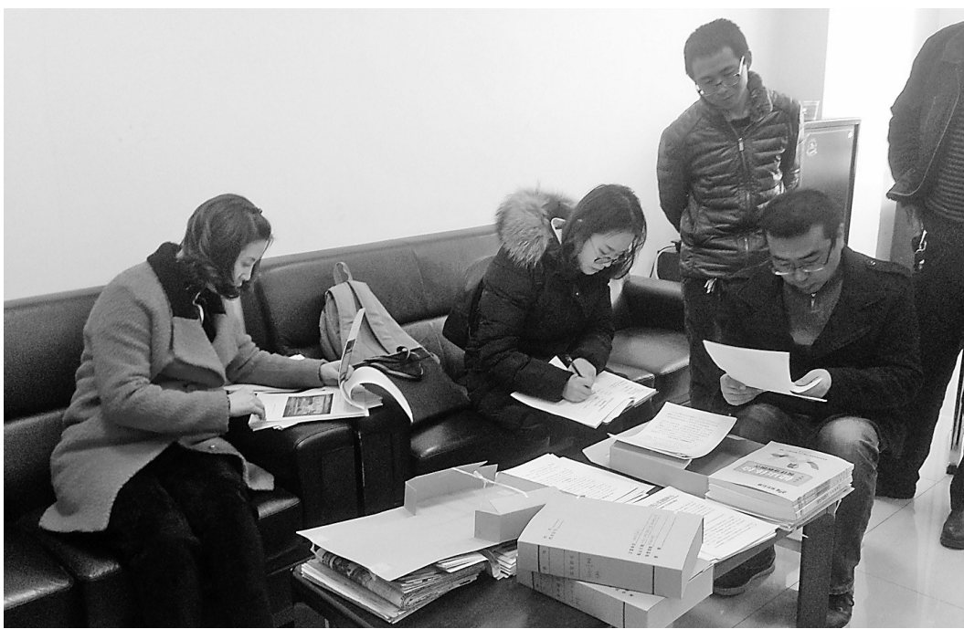
督查组对延长油田公司进行督查

据了解,年后我市即将迎来“国卫”技术评估,市创卫办希望相关单位部门尽快解决健康教育和健康促进工作存在的问题,确保我市“国卫”技术评估顺利通过。