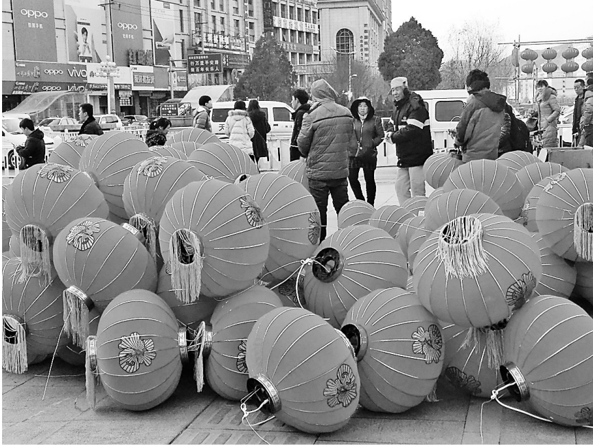
● 一堆堆的灯笼等待安装

春节将至,市养护处组织人员对延河大桥等市区大桥进行迎春灯饰设计和布置。今年的城市灯饰以传统大红灯笼为主,寓意红红火火、平安吉祥。1月11日,记者在延河大桥看到,工作人员正在加紧安装灯