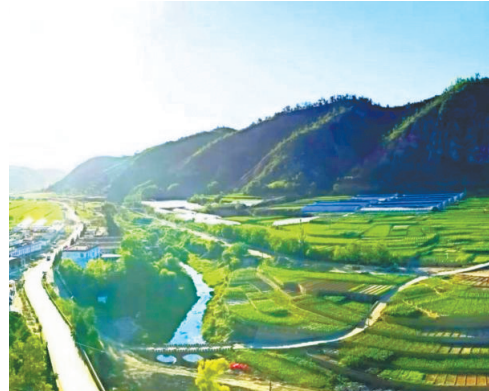
● 廖公桥乡村振兴示范村

B 玉家湾秀延县苏维埃政府旧址——玉家湾革命历史展室——黄米山狄青古寨——周家山民俗村——黄米山文创基地——重耳养心谷