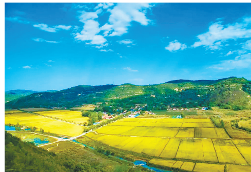
● 直罗胡家坡田园综合体百亩稻田

B 富县县城——太和山道教文化景区——羌村小镇——杜甫故居——新民示范园——柳梢湾水利风景区