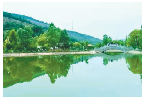
● 吴起退耕还林公园

路线推荐： 吴起县城——周湾边塞蓝湖——大吉沟森林公园——南沟生态度假村——袁沟生态度假村