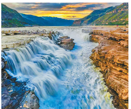
● 壶口瀑布风景名胜AAAA