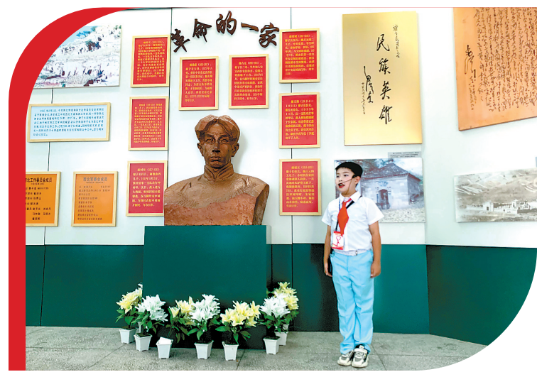
红领巾讲解员在子长革命烈士纪念馆为游客讲解

“我们所在位置就是子长革命烈士纪念馆，该馆于1989年被国务院批准为全国重点革命烈士纪念建筑物保护单位……”近日，在子长革命烈士纪念馆，红领巾讲解员正在为游客讲解。今年以来，子长市在各学校中选拔了一批优秀的“红领巾讲解员”，在重要节日、寒暑假等时间节点，为游客讲解红色故事，传承红色基因。