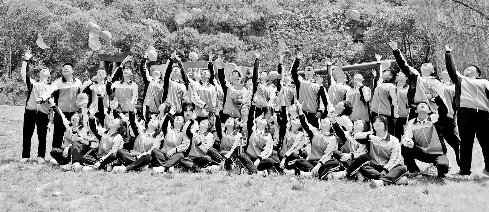
● 黄龙县中学学生在树顶漫步实践基地