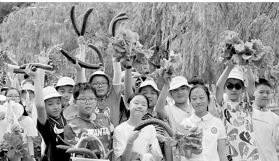
● 学生们在龙园劳动教育实践基地体验采摘乐趣