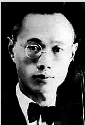
张贞黻 (1905年—1948年)，化名周怡，中国大提琴家、音乐教育家，浙江奉化人，延安鲁艺音乐系教师、延安乐器厂厂长、延安中央管弦乐团副团长、晋冀鲁豫人民文工团副团长。