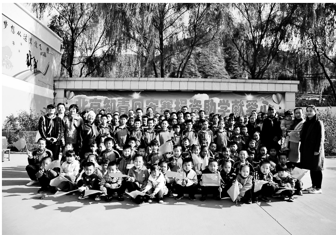
● 北京知青代表与安塞镰刀湾小学师生在一起