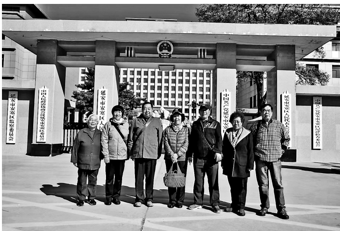
● 2019年11月，北京知青代表在安塞区委、区政府大门前合影

扶犁耕地在农村是一项技术活。它比拿粪苦轻，但技术性更强。一般扶犁的都是中老年人，而拿粪的主要是青壮年。我拿了一段时间的粪之后，便向扶犁的大爷提出想学耕地的技术。他欣然同意了。