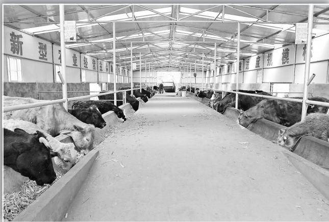
● 长官庙镇齐桥村集体肉牛养殖场