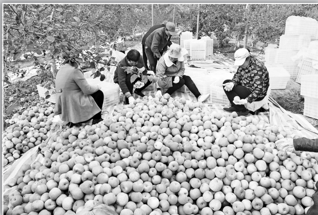
● 山地苹果喜获丰收

持续落实兜底保障政策，2022年已为184名脱贫人口发放低保110万元，落实临时帮扶政策69人次6.27万元。持续落实安全饮水政策，投资27万元实施饮水安全工程6处，累计安装净水机1022台，确保饮用水水质全部达标。