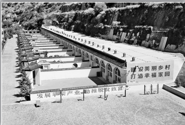
● 长官庙镇清凉寺村美丽乡村示范点