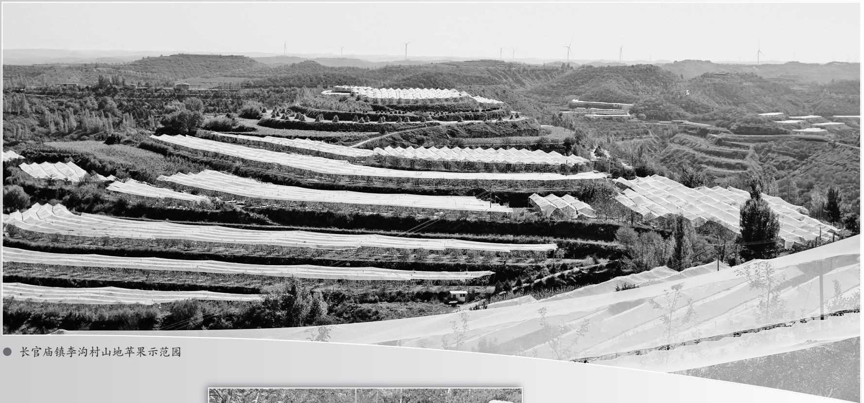
● 长官庙镇李沟村山地苹果示范园