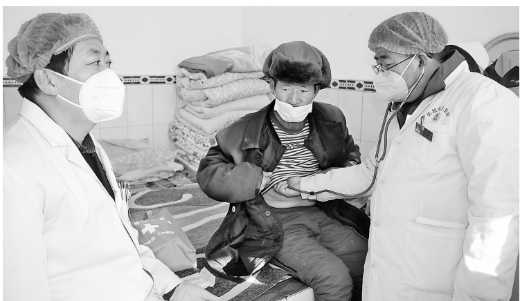
● 医护人员上门为行动不便的老人提供医疗服务

据统计，截至目前，“流动医院”共计为全镇127名重点人员进行了敲门问诊，发放各类药物500余盒，口罩1000余个，新冠康复手册300余本，爱心大礼包80个。