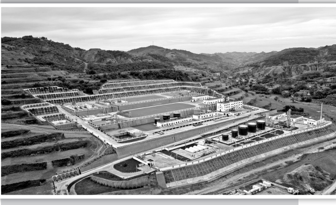
● 杨家园则天然气净化厂