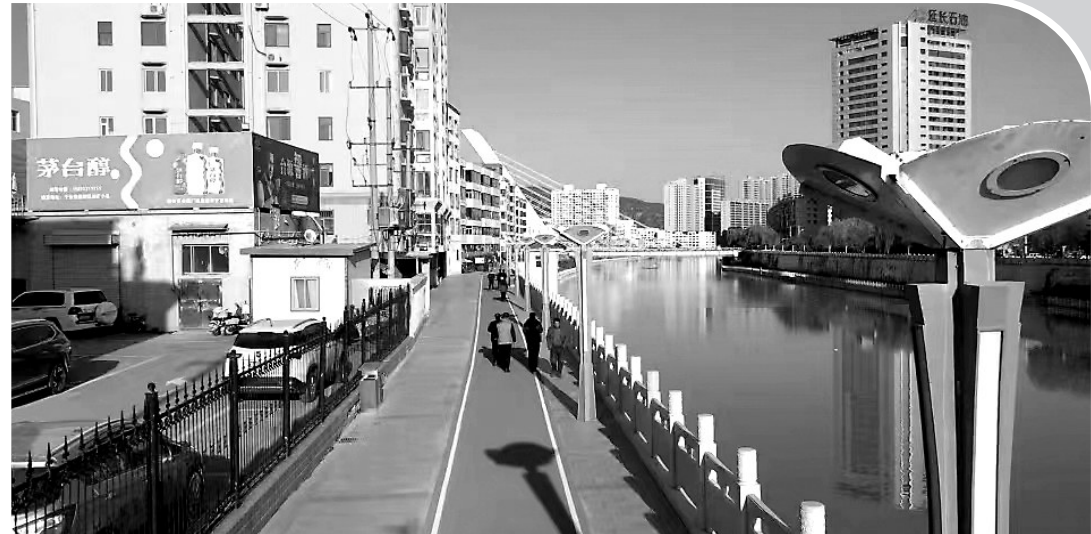
● 秀延河北岸的健身步道