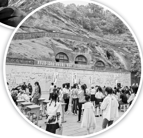
● 文化旅游活动丰富多彩