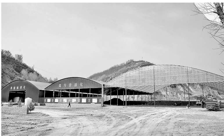
● 志丹县有机肥加工厂