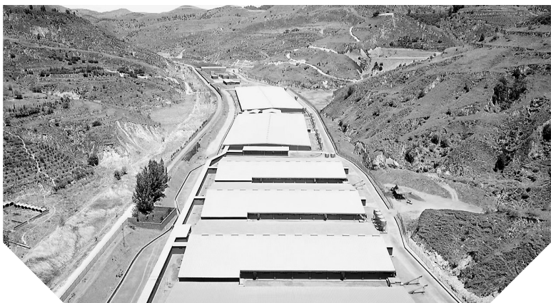
● 新希望志丹种猪繁育基地