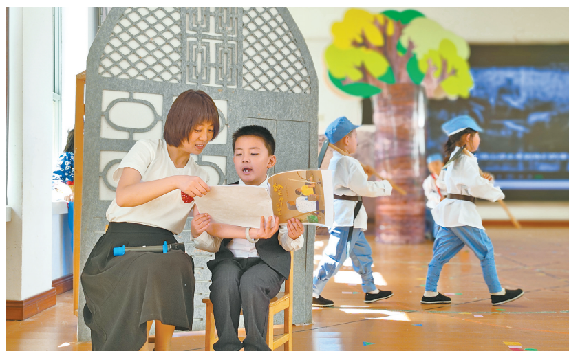
● 延安洛矾保育院师生正在排练绘本剧《外婆的一百万个梦》

绘本，又叫图画书。是用图画和文字，配上恰到好处的装帧设计，共同叙述一个完整故事，是图文并茂的文学艺术。绘本文中精炼优美的文字、细腻丰富的图画和简洁明了的故事情节