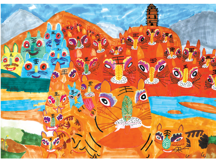
● 指导老师 刘栓 《延安绣梦》 宋佳作