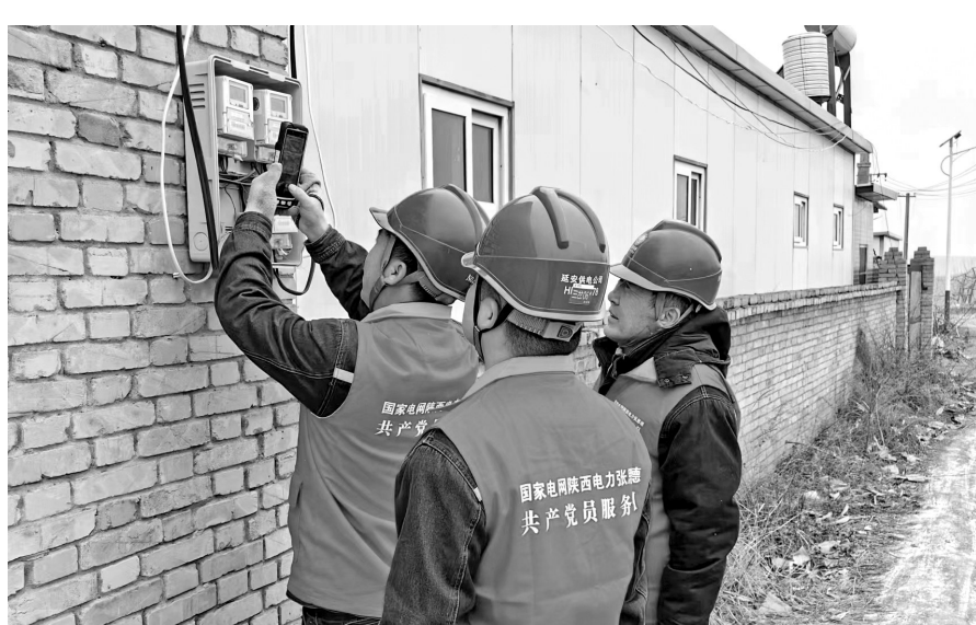
● 党员服务队检查电路

近年来，国网黄龙县供电公司深入学习贯彻党的二十大精神，坚持以人民为中心的发展思想，以优质的服务不断优化电力营商环境。国家电网陕西电力张思德（延安黄龙）共产党员服务队，通过强化供电服务保障、提升客户服务品质，在满足