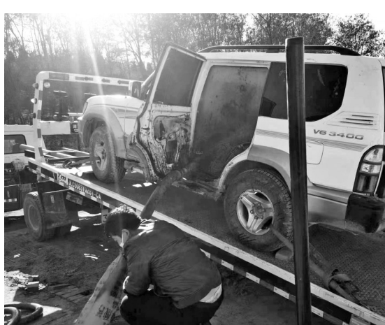
● 公安人员查扣偷运原油改装车辆

本报讯（通讯员 秦延平）子长市公安局石油安全保卫大队按照市油气田及输气管道安全保护工作联席会议办公室的安排部署，全面开展春季油气田治安秩序集中整治行动。活动开展以来，石油安全保卫大队快速侦破某盗窃原油案、野某飞盗窃原油案，采取刑事强制措施1人，行政拘留1人，查扣盗取原油车2辆，收缴原油4.2吨，调解涉及油气企业生产纠纷事件3起，有力维护了该市油气企业正常生产秩序，为油气企业高质量发展起到了保驾护航的作用。