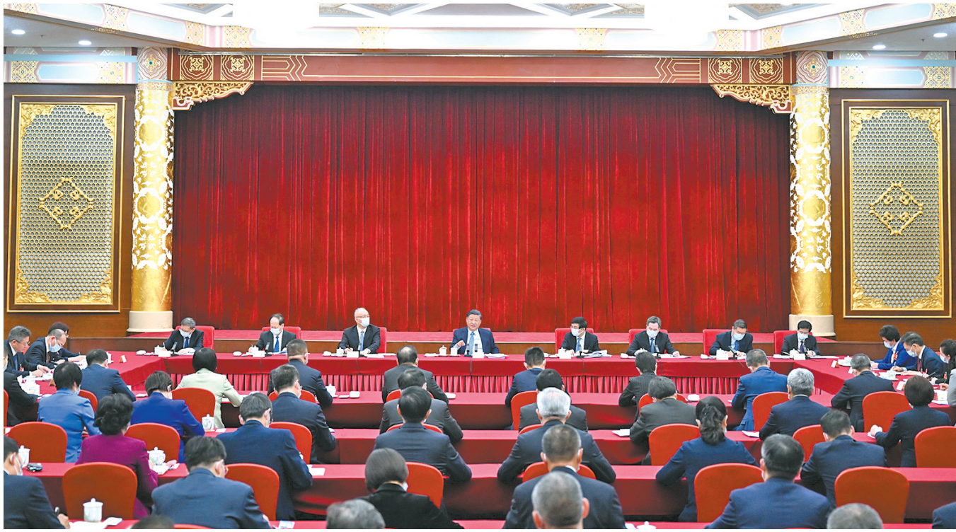
● 3月6日,中共中央总书记、国家主席、中央军委主席习近平看望参加全国政协十四届一次会议的民建、工商联界委员,并参加联组会,听取意见和建议。