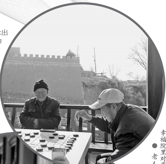
幸福院里对弈娱乐 ● 老人们在这里

上,中塬村全体村民展示出的心连心、同呼吸、共命运的血脉情深,让人感触颇深,农村集中照护的养老服务模式,为乡村振兴战略的实施提供了有力保障,更为持续深化拓展新时代文明实践提供了有力的方向。