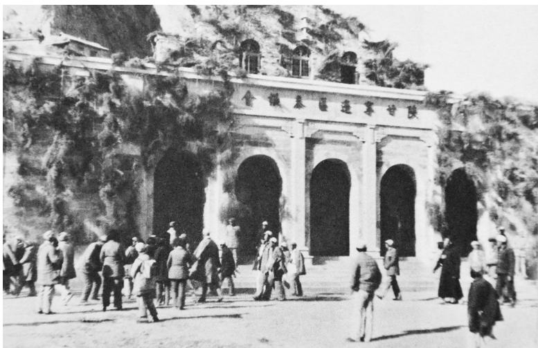
● 陕甘宁边区参议会大礼堂

1937年12月,边区经过选举产生了500多名边区议会议员。由于战争环境和其他原因,边区议会未能及时召开。1938年7月,首届国民参政会在武汉召开,并制定了省、市参议会的组织条例。为了抗日民族统一战线的需要,1938年11月25日,陕甘宁边区政府发布训令,将边区议会改为陕甘宁边区参议会,所选出的边区议员改为边区参议员,并决定在1939年1月召开边区第一届参议会。1939年1月6日至8日,陕甘宁边区政府召开县长联席会议,决定了边区政府各厅、处负责人。1月12日,中共中央书记处召开会议,讨论陕甘宁边区参议会问题。毛泽东在会上发言指出:“六中全会后边区工作要有一个推动,要从边区议会做起,使边区能应付困难环境,造成对外友好的影响。因此边区议会要开,国民党攻击我们立异,我们为实行民主制度必须立异,否则不能表示我们的进步。会议名称仍用参议会好。(陕甘宁边区政府主席林伯渠在会上说,重庆国民党方面来电,提出边区参议会是否改为准备会,并不向外宣传)边区问题解决必须坚持下列原则:(一)边区事情由我们办;(二)保证民主制度。”(毛泽东年谱)关于摩擦问题,毛泽东指出,我们的原则是:人不犯我,我不犯人;人若犯我,