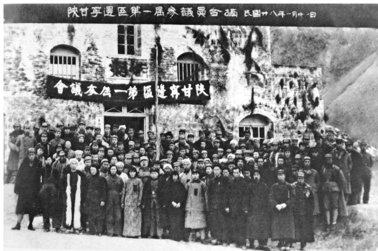
● 1939年1月,陕甘宁边区第一届参议会参议员合影

开。到会的参议员145名(其中有边区政府聘请的12名)。毛泽东、张闻天、陈云、王稼祥等出席了开幕式,并作了讲演。这次会议的议程有三项:第一,听取林伯渠的政府工作报告;第二,讨论并通过《陕甘宁边区抗战时期施政纲领》及其他单行法规;第三,选举边区参议会和边区政府领导人员。大会通过了《陕甘宁边区政府组