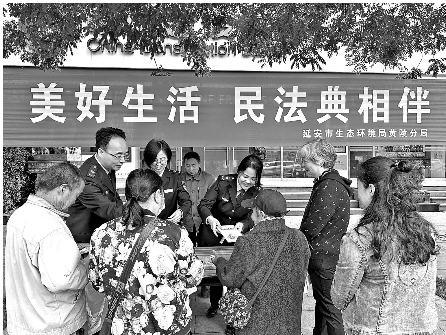
● 延安市生态环境局黄陵分局街头开展民法典主题宣传

市委普法办、市司法局利用法治延安微信平台开展民法典知识有奖竞答活动，推动宣传民法典深入人心，累计参加人数1.2万余人。动员全市各级各部门单位转发“天天学法”“每日一典”，进一步提升宣传民法典的覆盖面和影响力。市公安局组织开展民法典集中宣传活动，深入宣传民法典实施以来在保障人民群众合法权益等方面发挥的重大作用。市人社局利用人社干部大讲堂、职工大会，开展民法典宣讲。市市场监管局联合宝塔区市场监管局在全市六个社区广场开展集中普法宣传活动，用通俗易懂的案例给居民讲解法律条文，提升法律意识。全市城市管理执法部门结合“城市管理进社区，服务群众面对面”专项活动，以民法典进社区为载体，以典型案例讲解、发放彩页等形式，对辖区居民、门店、商贩开展民法