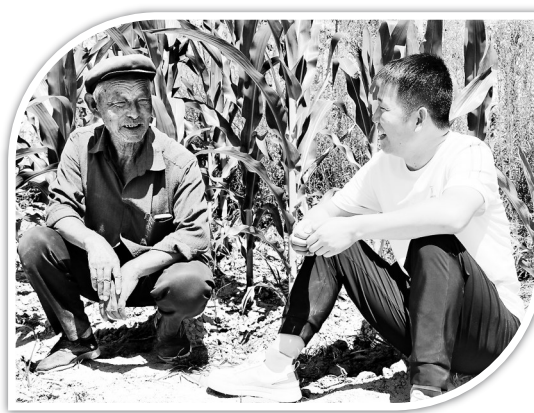
● 云文(右)与村民拉家常