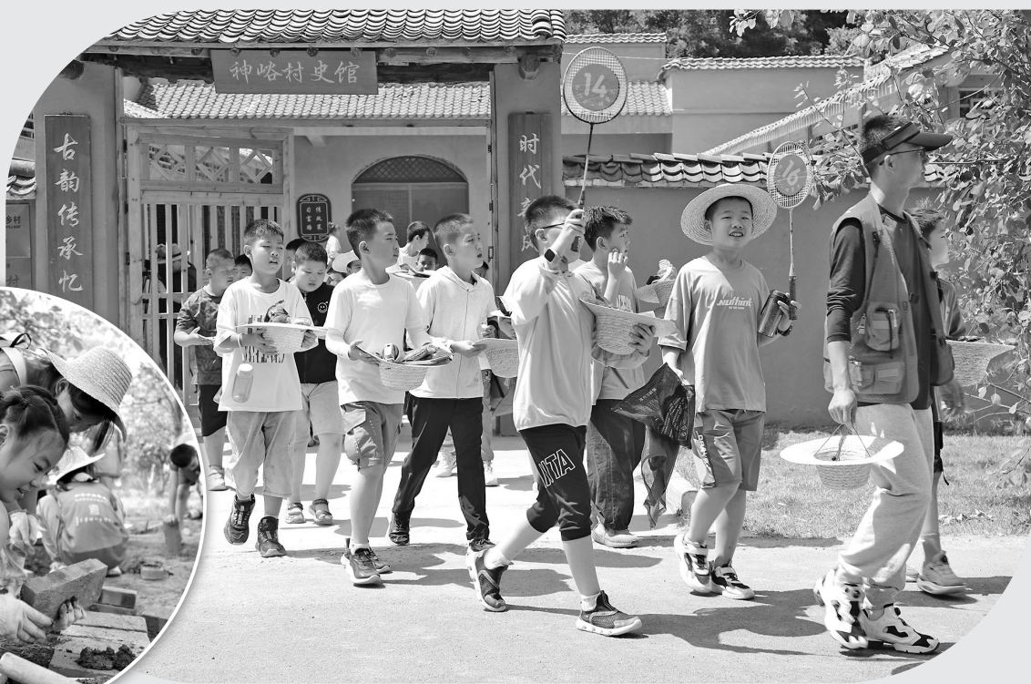
● 学生们参观神峪村村史馆