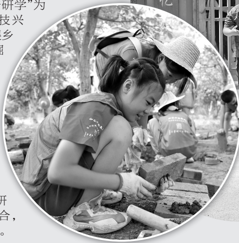
● 学生们体验胡基制作

黄龙县白马滩镇依托得天独厚的山水资源，以“康养度假、科普研学”为主线，坚持“研学兴村、科技兴农”，不断引进社会资本发展乡村文化旅游产业，充分挖掘地方特色资源，探索“研学+民宿”“研学+乡村旅游”“研学+露营”等新兴研学旅游发展模式，成功打造了“印象圪崂”劳动教育基地、暖山河畔露营地、碾子湾白马滩田园民宿等一批乡村研学旅游项目，形成白马滩镇研学旅游特色品牌，有效促进了研学旅游和乡村振兴有机融合，助力全镇乡村旅游持续升温。