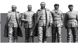
延安革命旧址 是一本永远读不完的书