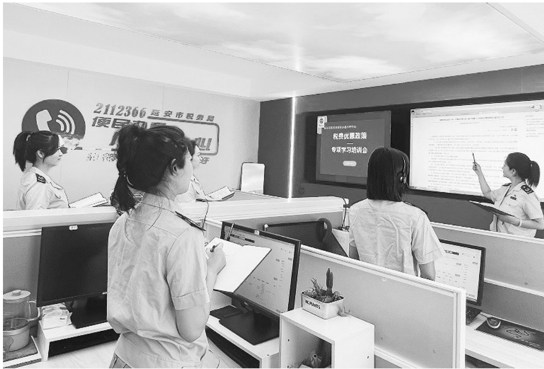
● 工作人员正在进行税费优惠政策专项培训

与此同时,市税务局练好“真功”,做好纵横联动落实工作。该局充分发挥12366热线“舌苔与脉象”作用,精准落实12366闭环管理机制,立足纳税人缴费人的需求,编制了《延安市税务局税费优惠政策汇编》,确保政策红利直达快享。各业务科室联动搜集整理目前执行的税费优惠政策,形成纾困合力,消减纳税人缴费人堵点难点问题,还及时收集近期工作热点、难点问题,建立日常闭环工作收集及反馈机制,确保税费优惠政策落实落细。