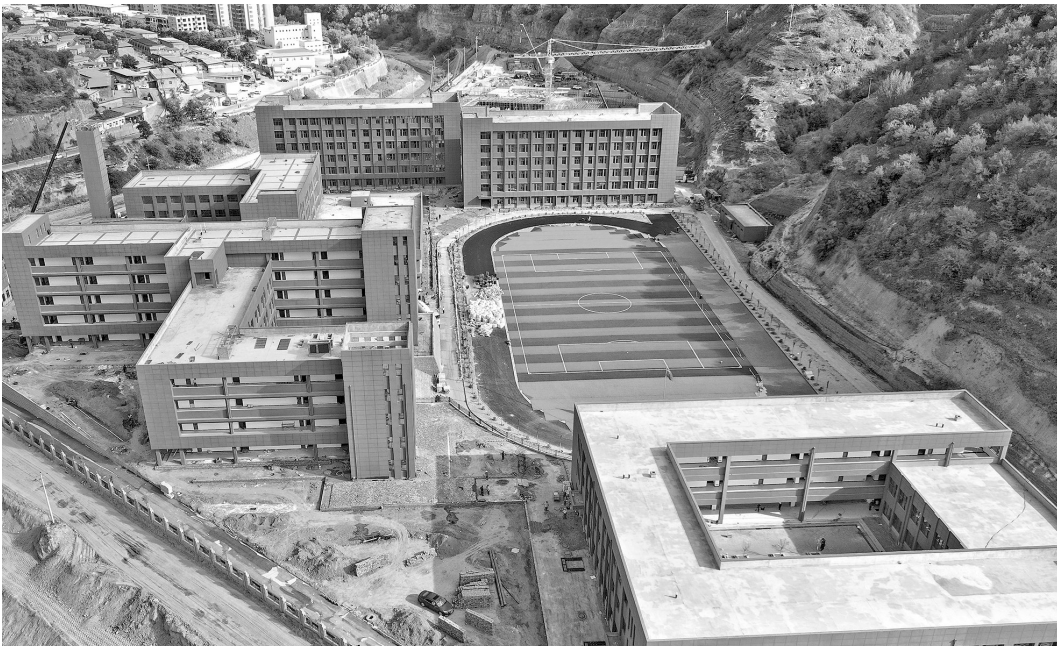
● 进入扫尾施工阶段的吴起县新建职教中心及附属工程

据了解,该项目属于石油化工产业链,也是2023年省级重点民生项目之一,由延安汇能达新能源有限责任公司投资建设,总投资5.5亿元,于今年3月开工建设。项目总占地面积166.2亩,建筑面积1.7万平方米,主要包括日处理100万方的天然气净化、液化装置各一套,2.9万方液化天然气储罐及35kV变电站等。