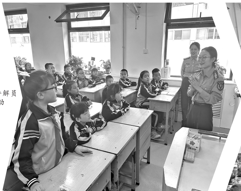
讲解员与学生互动