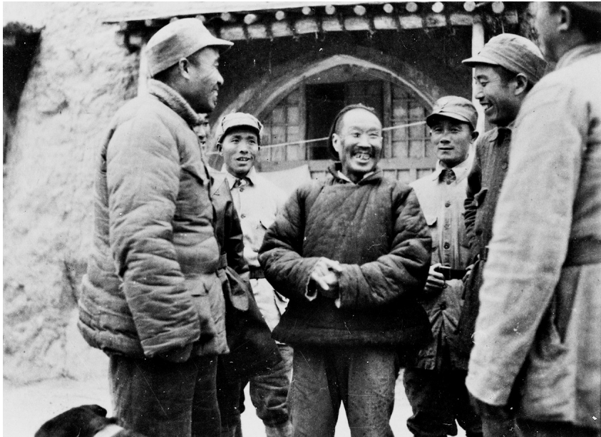
● 朱德在吴家枣园同边区劳模吴满有谈话