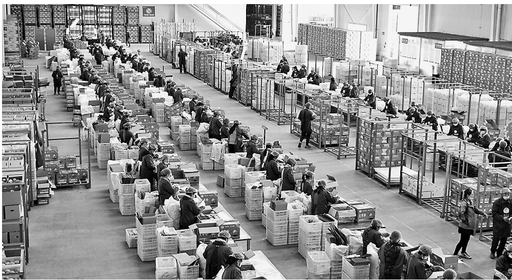
● 集中装箱发往全国各地