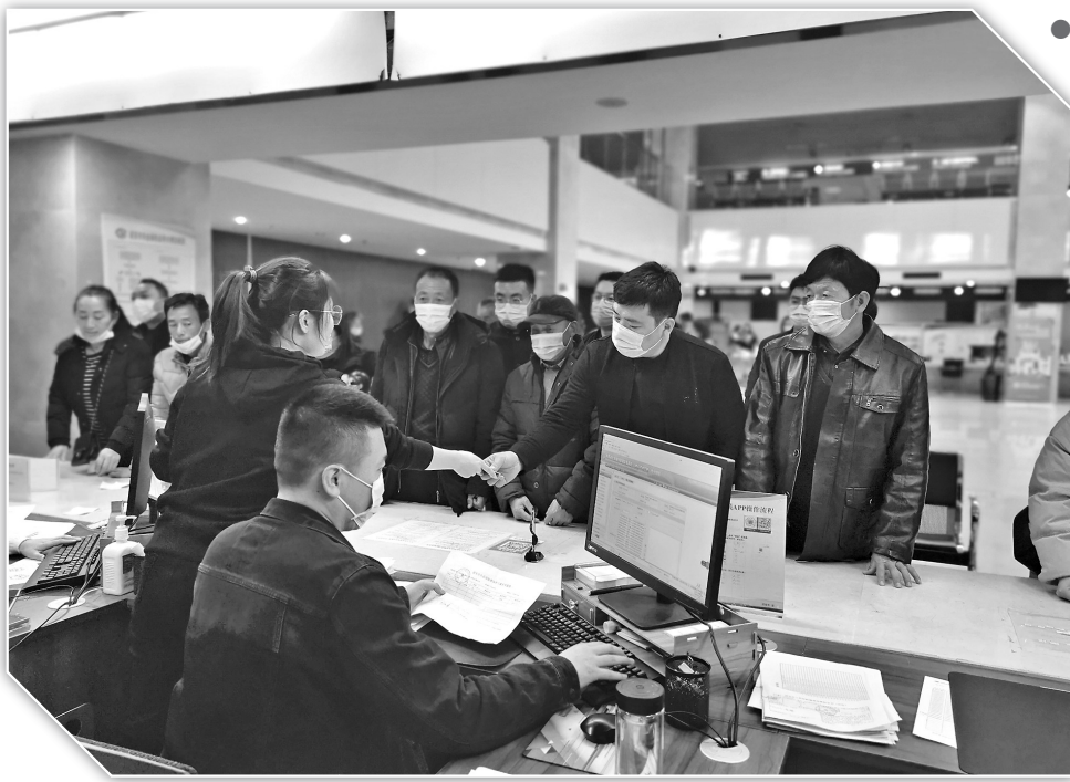
● 便捷高效办理失业保险业务

失业是指有劳动能力、处在法定劳动年龄阶段并且有就业愿望的劳动者失去或没有得到有报酬工作岗位的社会现象。失业保险是我国社会保险的重要组成部分,是指国家通过立法强制实行的,由社会集中建立基金,对因失业而暂时中断生活来源的劳动者提供物质帮助,并促进其再就业的制度。我国历来高度重视失业保险工作,不同历史时期均能稳步推进。党的十八大以来更是趋于完善,进入快车道,形成了“保生活、防失业、促就业”三位一体的失业保险复合功能体系。 我市失业保险工作开展始于改革开放初期的1986年,在经历了起步探索、调整理顺、巩固发展三个阶段后,有了长足进展,取得了令人瞩目的成绩。2006年成立失业保险经办机构,一方面为深化我市经济体制和劳动制度改革,提供了可靠保障;另一方面保障了失业人员的基本生活,促进了失业人员再就业,一定程度上预防和减少了失业,为我市经济社会发展和社会稳定作出了贡献。