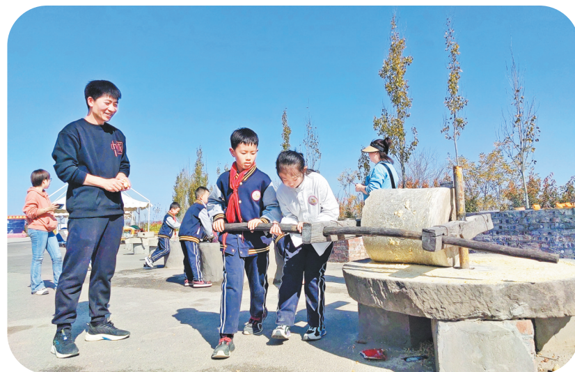
● 学生们体验石磨玉米面

时值金秋，瓜果飘香。田地里，连片的玉米整齐有序、横竖成行，传递着丰收的喜悦。为倡导尊重自然、顺应自然、保护自然的环保意识，让同学们在大自然中深切感受“绿水青山就是金山银山”，在身体力行地劳作中体验“劳动最光荣”，10月29日，延安新区第二小学2022级8班的同学们走进安塞区南沟全国中小学劳动教育综合实践（延安）基地，开展了“启航绿水青山之路，传承生态文明精神”第三课堂实践活动。 暖阳下，同学们走进田地，分工合作、相互配合，割玉米、搬玉米、运秸秆、剥外皮……快乐地忙碌，辛勤地劳作，不一会儿，田间金灿灿一片，玉米堆成了一座座小山。 而在果园里，一颗颗红润饱满的苹果挂满了枝头。同学们一个个“大展身手”，有的伸手摘树上的苹果，有的捡地上掉落的苹果，大家动作麻利、干劲十足，现场一片欢声笑语，热闹非凡。