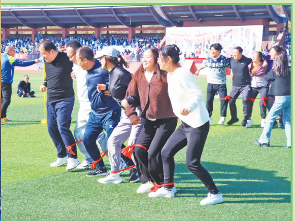
▲ 有趣的“蛟龙出海”游戏 ▲ 激烈的篮球比赛