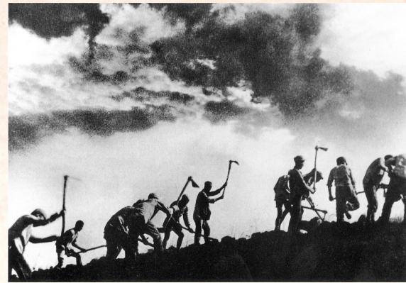
● 当年359旅南泥湾大生产(资料图片)

到抗战结束,延安已拥有炼铁、炼油、机械制造、军工、化工等行业,纸张、煤炭、棉花等产品也实现了自给或半自给。自力更生、艰苦奋斗的创业精神,从另一个维度书写着延安的传奇。