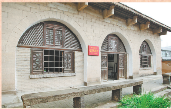
● 凤凰山麓毛泽东旧居

渴求信仰的生命如大江大河,只有不断流淌,一路前行,才能收获奔流入海的壮阔境界;只有经历九曲十八弯,才会迸发出惊人力量。