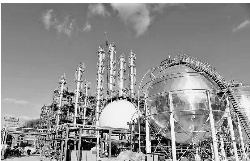
志丹县石油伴生气综合利用项目

这是志丹县聚焦强链延链补链的一个缩影。今年，志丹县立足新发展阶段、贯彻新发展理念，扎实开展高质量项目推进年活动，着力构建