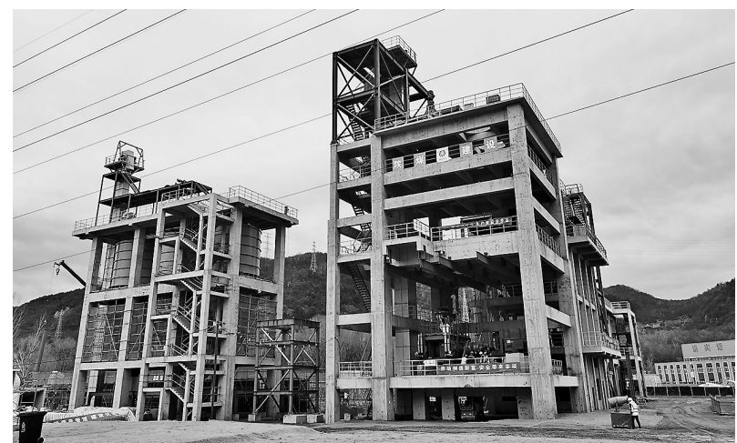
黄陵县年产40万立方煤矸石制陶粒项目施工现场

贺帆说：“按照‘数据打通、系统连通、平台贯通，一套探头一张网’的思路，我们整合了视频线路2700余条，连通了城管、公安、防汛、防火等各类业务系统98个，汇聚了31个部门的业务数据及各类数据6亿余条，发布了数据共享服务380项，使用数据服务达7万余次，解决全县业务数据找不到、不准确、用不上的问题，数据使用