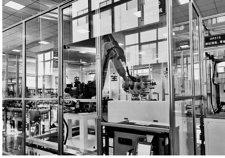
甘泉县储能电池装配厂项目生产车间

试并实现投产，预计11月底PACK生产线实现进场安装调试，年底前完成全部建设任务并投产运营。 据介绍，延安新材料产业园新型装备制造项目由延安众邦能源设备制造有限公司投资建设。该公司专注于油气田增压设备的研发、生产制造和运营，目前拥有多项专利技术，其独创的设计成功解决了多相增压技术这一国际难题，自主研发的TD多相增压装置被广泛应用于油气田等多个生产场景，实现了增产增效、节能环保，开创了绿色、智能、高效、无人值守的运营模式。 延安新材料产业园新型装备制造项目的建设，将进一步提升区域内油气等能源产业配套服务能力水平，极大减少油气田的投资建设和运营成本，对推动油气田生产行业节能增效、安全环保及降低运行成本、提高行业竞争力具有重要意义。同时，将有力推动区域内新能源产业链发展，完善和提升产业新能源配套服务能力水平，为推动能源结构变革、提升清洁能源占比、实现碳中和目标 本报（记者 刘小艳 乔建虎 实习记者 赵合欢）今年以来，为推动产业转型升级、制造业高质量发展，宝塔区坚持“专精特新”发展定位，强化“强招引、优服务”工作举措，启动实施了延安新材料产业园新型装备制造项目。 该项目总投资7500万元，使用标准厂房9200平方米，由TD多相增压设备制造、1000MWh锂离子电池储能总装制造基地项目组成。其中，TD多相增压设备制造项目于2023年5月30日签订招商协议并落地建设，7月27日完成厂房改造并实现部分生产线进场安装调试，9月20日实现中国第一台TD多相增压油气田设备下线并交付客户，10月23日在延长气田采气一厂128大队落地的TD多相增压油气田设备安装调试并正式投入运营，打造了第一个本地化示范项目，预计年底前完成全部建设任务并投产运营；1000MWh锂离子电池储能总装制造基地项目于2023年6月8日落地建设，7月15日完成eBlock系统集成生产线进场安装调试