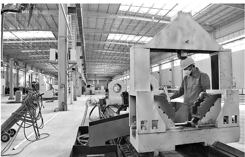
● 高新区制氢储氢设备制造项目

今年以来，高新区扎实开展“三个年”活动，全面推进落实市委六届五次全会提出的新时代延安加快中国现代化建设的“一六四”工作布局，坚持以招商引资、项目建设组织经济工作，以高质量项目推动高质量发展，众多项目竞相发展，呈现出勃勃生机的景象。