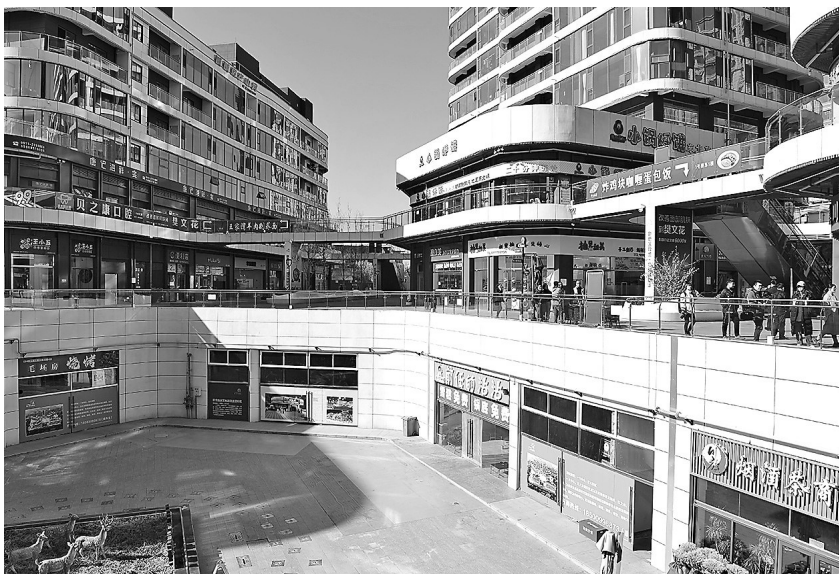
● 延安上城新世纪K-PARK项目

工建设延安上城新世纪K-PARK项目。该项目总占地38.03亩，建筑面积6.1万平方米，其中地上建筑面积4.1万平方米，地下面积2万平方米，总投资1.8亿元，2022年9月建成投入运营，倾力打造集运动休闲、娱乐、餐饮、购物为一体的新生活体验地。