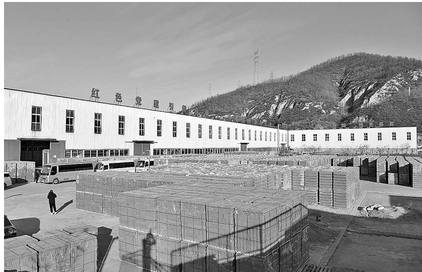
● 高新区绿色建材循环利用产业园高档仿古砖项目现场