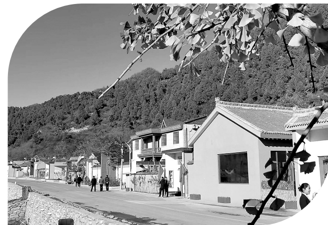
● 黄龙县白马滩镇神玉村一角

青翠黄龙城，好山好水好风光。黄龙县正在依托得天独厚的生态资源，全力打造生态休闲旅游，奏响以旅兴城的高质量发展“奋进曲”。