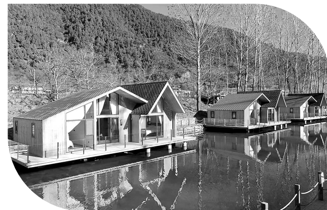
● 暖山河畔田园综合体项目一角