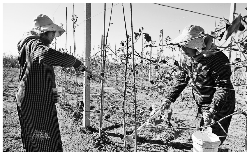
● 果农正在给果树涂白

旧县镇洛阳村最近也没有闲下来。今年,该村新建了一块矮化密植示范园。近期,果农们正在忙碌着进行涂干、培土。该镇经济综合服务站的技术人员来到地头进行培训,指导大家按照冬季果园管理的相关要求,全力做好当