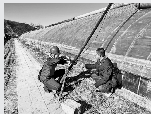
● 供电所工作人员检查大棚线路安全

本报讯（记者 贺秋平 郭子仪 实习记者 强雨欣）冬日时节，田间的大棚外寒意阵阵，棚内却是暖意融融。在甘泉县下寺湾镇闫家沟村千亩融合农业示范园里，大棚种植户们正忙着冬种、冬收，为即将到来的元旦和春节蔬菜市场做准备，大棚内外到处都是派热火热的忙碌景象。