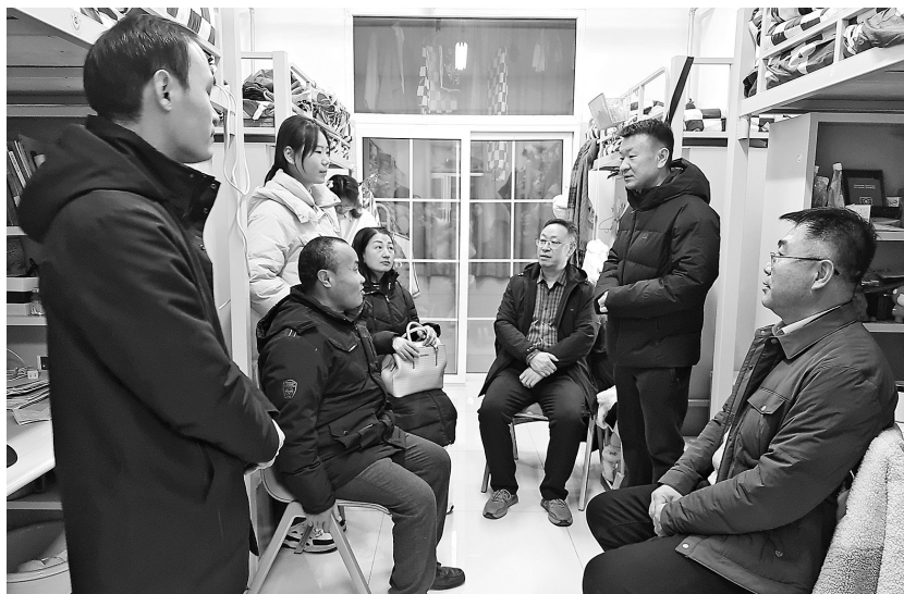
● 家长们走进宿舍了解学生校园生活