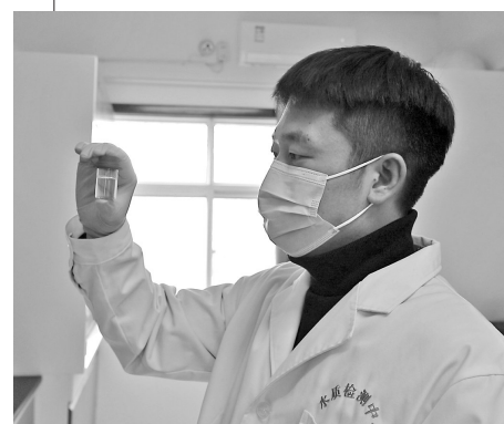
● 工作人员对水质进行监测化验

管理者们的“辛苦指数”换来了市民的“幸福指数”，谈起今年迎春的可喜变化，延川居民们赞不绝口。网民“一路向前”发表留言：“好样的！今年的年味就是不一样，你们辛苦了！”