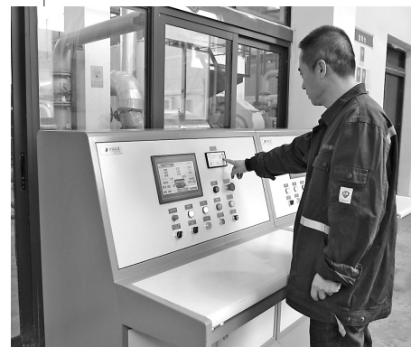
● 工作人员关注锅炉运行参数