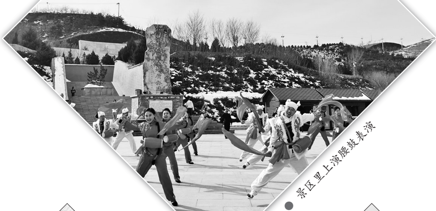
景区内上演腰鼓表演

富县交通运输局相关负责人表示,他们还落实凌晨0点至5点停车休息制度,确保行车安全。同时,加强了对公交车、出租车等城市交通司乘人员、经营者的安全培训,优化了对恶劣天气、乘车高峰时段的运力调配,确保旅客在春运期间“走得了”“走得好”。