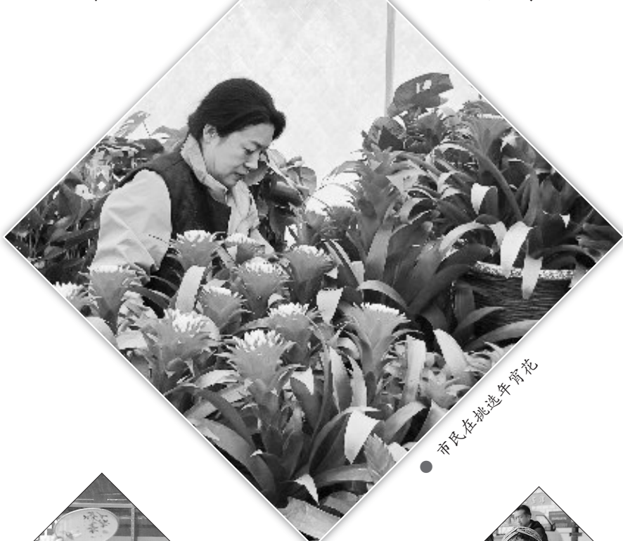
市民在挑选年宵花

“通过开展安全生产大检查宣传活动,辖区单位、居民的安全生产责任意识得到进一步提高,也对今后社区的安全隐患做到心中有数,为营造和谐稳定的安全生产环境奠定了坚实基础。”社区相关负责人表示,他们将进一步加强各行业领域安全隐患排查工作,坚决防范和遏制各类安全事故发生,以风险、保安全、护稳定的实际行动维护辖区人民群众生命财产安全,让辖区群众度过一个安全祥和的春节。