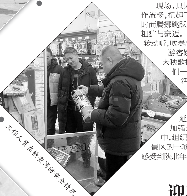
工作人员在检查消防安全情况