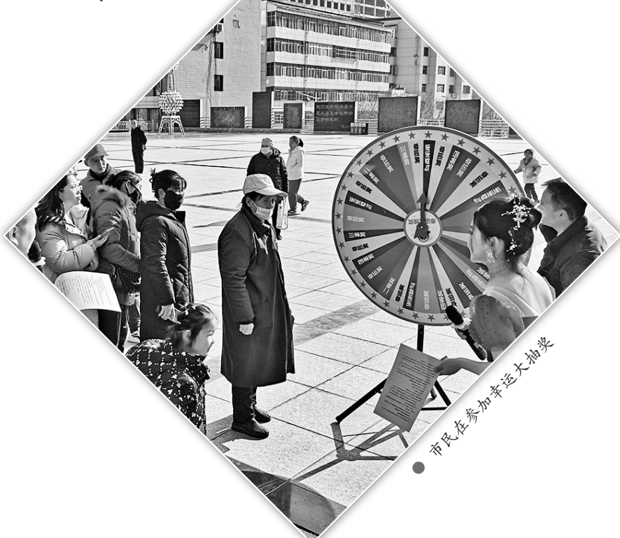
市民在参加幸运大抽奖

本次活动,吴起县文化市场综合执法大队共为全县人民送出各类文化年货3万余份,其中包括宣传年画、灯笼、福字、春联、手提袋和印有文化执法字样的纸杯、口罩等,进一步丰富全县人民群众春节文化生活,营造了欢乐、祥和、文明、喜庆的节日氛围。