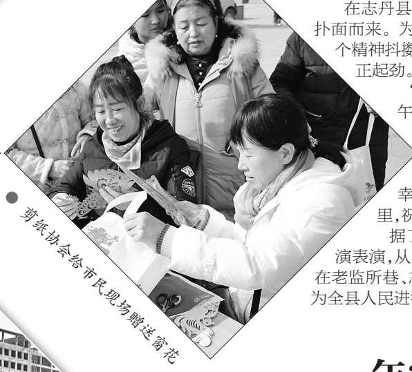
剪纸协会给市民现场赠送窗花