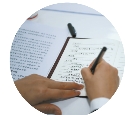
2月26日,市政协六届三次会议开幕式上,政协委员专心听取工作报告,并认真记录。