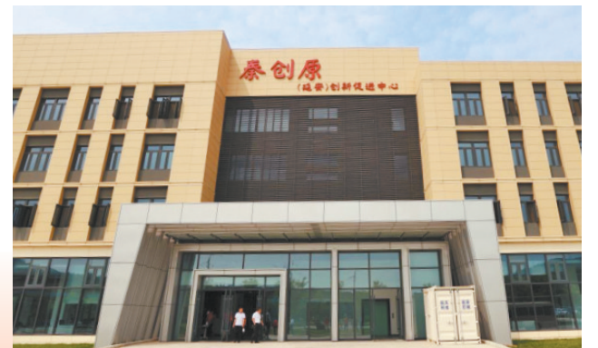
● 秦创原(延安)创新促进中心

“秦创原”这个名号深入人心。形成了一原多中心、提升两项服务、夯实三方责任、健全四个体系、建立五项机制的“12345”模式，构建起了延安高新区中心和安塞、延长、黄陵、延安大学分中心“一核四区”协同发展格局，“政产学研用金”创新体系逐渐形成。秦创原(延安)创新促进中心转化科技成果37项，新入驻企业和机构42家，总量达到94家，累计兑现奖补资金980万元。秦创原(延安)创新促进中心成为秦创原总窗口的联盟成员单位，获“全国版权示范基地”称号，认定为省级技术转移示范机构；宜川县被授予秦创原总窗口地市协同创新基地。