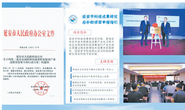
● 延安市科技局开展科技成果转化专项行动

科技成果转化是从技术到产业、产品的关键环节。制定印发了《延安市加快科技成果转化促进产业高质量发展专项行动方案》，开展科技成果转化“八个专项行动”，促成企业与高校院所签订科技合作协议234项，签约金额4596万元，27项本土“三项改革”科技成果落地转化。引进汪应洛院士“煤矸石路基绿色低碳新材料”、牛育华教授“苹果面膜”、周春松院士“利用二氧化碳及工业废盐资源化利用技术”在延安开展试验示范。全市完成技术合同成交额17.93亿元，较上年增长34.01%，延安市技术转移中心获评全国技术合同认定登记优秀单位。