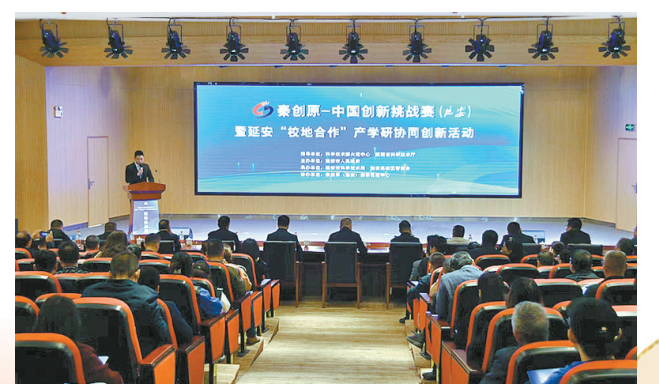
● 秦创原-中国创新挑战赛(延安)暨延安“校地合作”产学研协同创新活动举行

坚持政府搭台，企业唱戏，常态化开展各类项目路演对接活动。组织我市产业园区、高校院所和科技型中小企业积极参加进博会、丝博会、农高会以及各类科技创新博览会等活动，加强对外合作交流。以各类展会和秦创原创新促进中心为主阵地，先后举办“助力秦创原创新驱动平台建设暨延安能源项目对接会”“三项改革”进延安暨科技成果集中路演、延安市科技创新成果路演及项目签约会、创新挑战赛、科普讲解大赛等项目路演活动10场次，推介路演项目62个，路演项目落地企业3家。