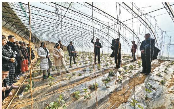
● 科技特派员开展科技服务

人才是第一资源。科技人才队伍的不断发展壮大，为创新提供了有力支撑。制定印发了《延安市创新人才攀登专项行动实施方案》，评选出第一批中青年科技领军人才、青年科技新星、科技创新创业人才等55人(支)。获批省级科技人才计划8人，省级科技人才达到39人(支)。选派市级科技特派员136人向基层一线下沉，开展科技服务。全市科技人才智库入库科技人才达到642人。从“洼地”到“热土”，攀登行动持续筑巢引凤。