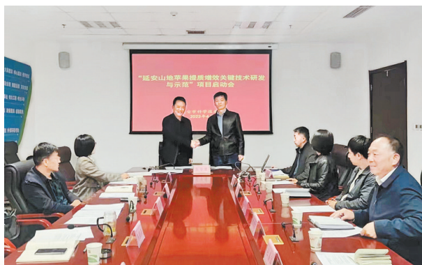
● “延安山地苹果提质增效关键技术研发与示范”项目推进会举行

科技研发是解决产业发展瓶颈问题的重要手段。制定印发了《延安市博士服务团进企业服务实施方案》，组织延安大学155名博士深入全市规模以上工业企业和科技型企业逐户开展科技服务，挖掘技术需求267项，解决技术难题40多个，签订技术需求合作协议33项825万元。针对重点产业链发展的“卡脖子”技术和关键共性技术难题，下达市级科技计划项目183项，组织市内外高校院所、企业和科研人员协同开展科技攻关，解决技术需求137项，形成省级科技成果49项，获省科学技术奖6项。争取省级科技计划项目73项、资金1815万元，两链融合重点专项“延安山地苹果提质增效关键技术研发与示范”项目获省科技厅立项批准；厅市联动项目“极薄煤层智能绿色开采”项目取得阶段性研发成果。