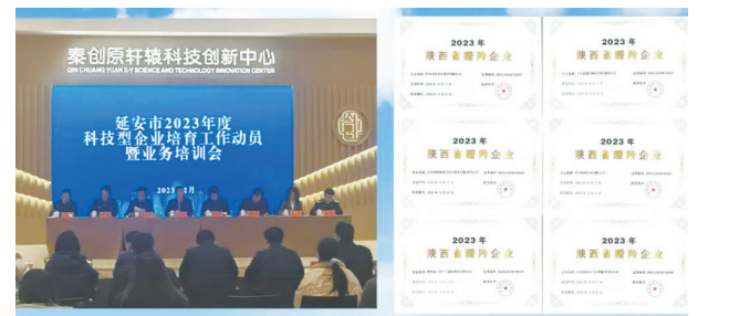
● 2023年度科技型企业培育工作大会现场和获批的2023年新晋瞪羚企业证书

企业是创新的主体。通过实施“登高、升规、晋位、上市”四大工程，兑现2022年度2家瞪羚企业、57家高新技术企业、555家科技型中小企业奖补资金2792.5万元，其中兑现民营企业2455万元，占87.92%。建立科技型企业梯队培育机制，先后举办科技型企业培育工作会议3期，培训企业300余家，深入各县区指导梳理科技企业潜在培育名单，制定分类差异化培育服务措施。全年评价入库科技型中小企业906家，较去年增长49.26%；招引落地高新技术企业7家，总数达到228家，较去年增长130.30%；获批陕西省瞪羚企业6家，较去年增长300%。