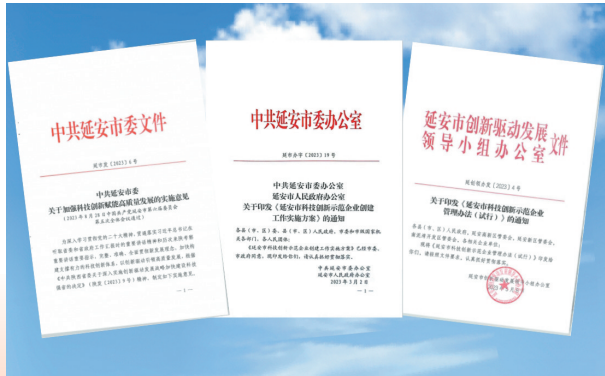
● 市委、市政府出台的政策文件

省委十四届四次全会出台了《关于深入实施创新驱动发展战略加快建设科技强省的决定》后，市委六届五次全会审议通过了《中共延安市委关于加强科技创新赋能高质量发展的实施意见》，从创新平台建设、创新主体培育、创新机制改革、创新环境优化等7个方面出台了22条措施。各县(市、区)把科技创新工作摆上了重要议事日程，均成立了创新驱动发展领导小组，出台了相关实施意见或方案，从政策上支持，资金上保障。2023年，市级财政投入科技创新专项资金1960万元，市县、管委会兑现各类科技创新奖补政策资金4011.5万元。