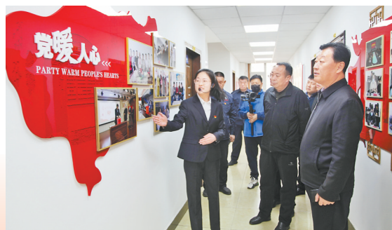
● 党建宣传工作暖人心

深入推行“三个三”党建与业务深度融合工作法,深化“干部作风能力提升年”活动,一体推进主题教育活动,大兴调查研究、“清廉监管”建设和行风建设专项攻坚行动,举办“市场监管大讲堂”7期,开展“业务知识月月考”,开展县级领导读书班2期,专题研讨5次,党组成员及党支部书记讲党课15次,完成调研课题10个,充分运用“四下基层”制度开展调研35次,廉政专题学习8次,组织领导干部讲授廉政党课2次,观看警示教育片3次,编印《市场监管系统违法违纪案例》,全力打造“市场卫士、服务先锋”党建品牌。