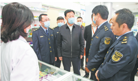
● 对药店开展执法检查

严格按照“四个最严”要求,通过“五个强化”,扎实开展药品安全巩固提升行动。制定印发《延安市药品安全巩固提升工作实施方案》《延安市医疗器械经营分级监管规定》,建立“市级督导、县级巡查、所级排查、企业自查”的四级联动风险隐患排查模式,采取“分级负责、网格管理、群防群控”的监管方式,共检查“两品一械”生产经营企业和使用单位3656家次,责令整改51家,立案查处143件,罚没款50余万元,移送司法机关9件;完成药品监督抽检394批次,药品安全巩固提升行动成效显著,荣获全省药品安全专项整治行动先进单位,连续三年获评全省“药品安全放心工程”先进集体。