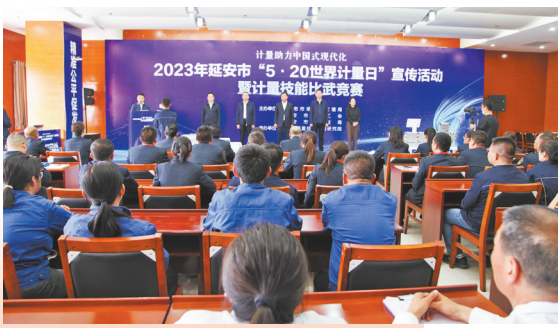
● 开展计量技能比武竞赛

制定发布7项市级地方标准,壶口瀑布旅游服务区和南泥湾特色农产品区域品牌建设获批国家级标准化示范区。开展“计量服务企业行”活动,膜式燃气表检定装置等9项社会公用计量标准被省局立项。能源化工、现代农业、文化旅游领域,共1256个组织获得3979张服务认证证书。推动国家级苹果及苹果制品检验检测中心建设,市级3个检验检测单位可开展2183项检验检测技术服务。开展“千企百城”商标品牌价值提升行动,全市拥有地理标志证明商标居全省第一。建成21家站点,帮扶企业解决问题。质量工作在全省考评中连续三年获评A级等次。