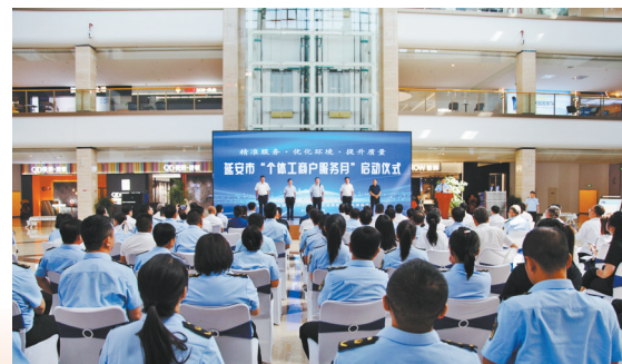
● “个体工商户服务月”活动启动

制定印发了《创建活动管理办法》《放心消费创建工作要点》《关于推进旅游景区开展放心消费创建活动的通知》。针对“3·15”晚会曝光问题,联合公安机关迅速调查取证、稳妥处置,得到市委主要领导充分肯定;持续跟进中公网培机构退费处置工作,需退费3680人已完成89%,得到省局通报肯定;配合省局第三方消费环境测评组完成了宝塔、志丹、吴起消费环境调查工作。全年共检查售卖水泥管、化妆品、大米等经营主体3560家,受理各类投诉举报12064件,答复各类咨询839件,期限内办复率100%,群众满意度100%。我市放心消费创建和消费环境综合指数连续四年均获全省第一。