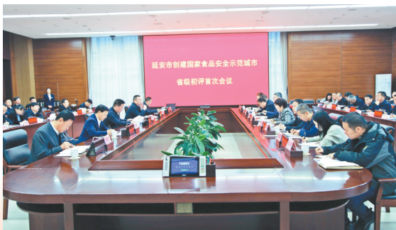
● 创建国家食品安全城市省级初评会现场

坚持“创建为民、创建靠民、创建惠民”的工作导向和“整市推进、县区主创”的思路,制定了《延安市市场监管局创建国家食品安全示范城市实施方案》,组织召开了全市创建国家食品安全示范城市大会、推进会、攻坚会、冲刺会;建立“包抓干部联系督导全域共创食安城市”工作机制,抽调14名四级调研员包抓县区创建工作,全面开展示范点创建“十百千”专项行动,累计打造示范典型点位6108个;在延安电视台开设创建国家食品安全示范城市“县长访谈录”“食安第一线”等系列访谈节目,广泛开展“食品安全宣传周”“食品安全进社区”等群众性宣传活动;采取明察暗访的方式,开展督查检查工作,通过国家食品安全城市创建省级初验。