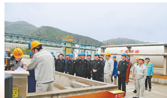
● 特种设备安全隐患排查

制定印发了《延安市市场监管局关于开展特种设备重大风险隐患排查整治工作的通知》,向全市特种设备安全生产重点领域发布《警示函》《告知书》;对全市特种设备开展交叉检查,排查整治一般安全隐患65处,发现重大安全隐患7处,已限期完成整改,对3处非法运行的大型游乐设备进行了封存,对8000余只达到设计使用寿命的液化气瓶集中进行了报废处置。全面普查登记公用燃气管道1100余公里,对全市25家燃气管道运营单位集中进行警示谈话,整改完毕问题隐患,并通过专家组复审。连续11年实现特种设备安全“零事故”,荣获“全省特种设备安全监管先进单位”。