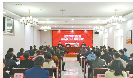
● 举办行政执法业务培训会

深化行刑衔接机制,推动行刑衔接“两会、三联、四协作”机制常态长效化,召开行刑衔接座谈会3次,市公安局驻市场警务联络室挂牌落地,开展联合督查1次、联合培训2次、联合执法10余次,行刑衔接工作取得新突破。全年共开展各类专项执法检查100余次,查办案件888起,罚没658万元,被评为全省知识产权保护工作先进集体、食品稽查工作先进集体和民生领域案件查办“铁拳”行动先进集体,在全省市场监管行评案卷评查和药械案卷专项评查分别位列第一。