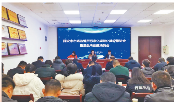
● 创五星市场动员会举行

以“高星引领、客观公正、评建并举、以评促建”为原则,立足自身特色,依托现有资源,勇于创新,分层分类大力推进基层市场监管所标准化规范化建设,加大督导力度,推进工作落实,全力夯实市场监管“基石”,吴起县五谷城市场监管所入选市场监管总局公布的首批五星市场监管所名单。