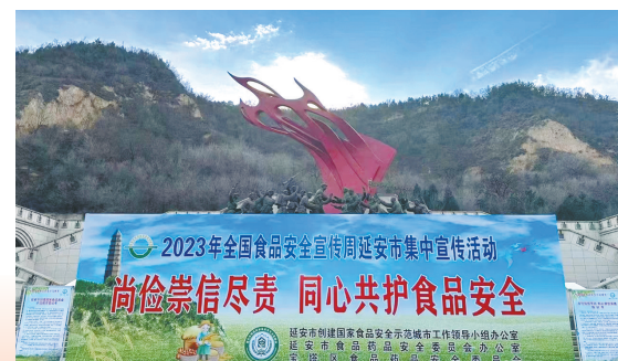
● 开展食品安全宣传活动

建立“三清单一承诺制度”,分层分级全面落实食品安全“两个责任”,市、县、乡、村“四级”5634名党政领导干部签订责任与任务承诺书,对全市2.7万家食品生产经营主体,实现了全覆盖;推广运用“责任上墙”和“日管控、周排查、月调度”工作机制,进一步完善食品安全风险防控责任体系,推动食品安全“两个责任”落地落实。制定出台全国首部农村集体聚餐地方性法规《延安市农村集体聚餐食品安全管理条例》,解决了农村集体聚餐无法可依的问题,聘任农村食品安全协管员1748名,登记农村集体聚餐1747次,有效保障了群众身体健康。