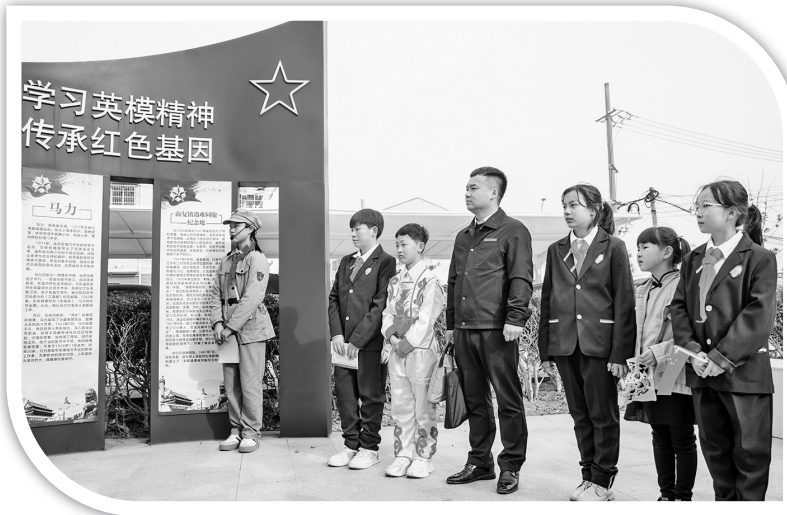
● 学生们参观启东红军小学

培养学生爱家乡、爱祖国的真挚情感，将学校教育与社会实践活动紧密结合，在延安抗日军政大学纪念馆的牵线搭桥下，上周，延安宝塔知新小学四名红领巾讲解员在老师的带领下前往江苏省启东