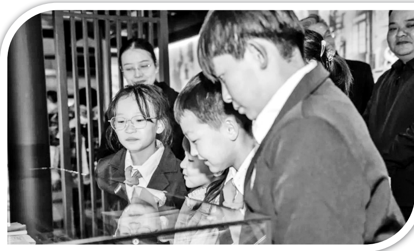
● 学生们参观通海垦牧公司

活动中，几名红领巾讲解员分别宣讲了红故事《崂山遇险》《卓然的西部情愫》，演唱了歌曲《东方红》《陕北姑娘》《爱上黄土坡》，并先后参观了中