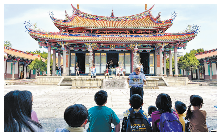
● 3月23日，台湾传统建筑研究专家李乾朗向小朋友们展示台北孔庙手绘图纸。

“今天，我们来画大成殿。首先，画一条横线，再画一条垂直的竖线，这样我们就有了房屋的基准……”