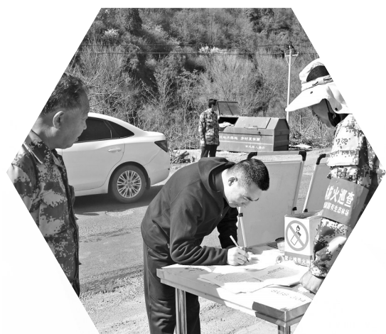
● 森林防火巡查员引导返乡祭祖人员登记