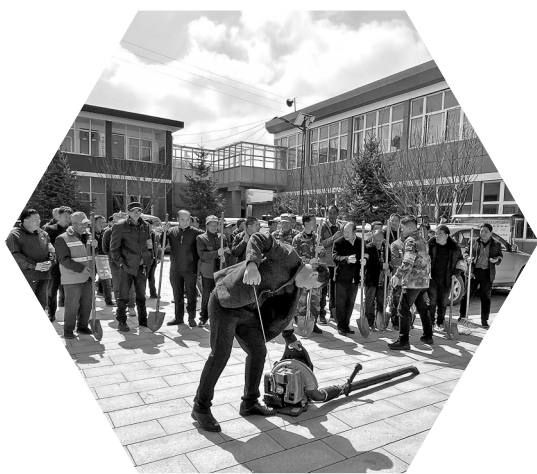
● 界头庙镇组织全镇防火巡查员和扑火队开展森林防火业务培训