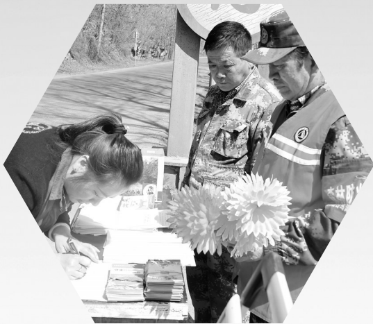
● 森林防火巡查员为群众免费发放祭祀鲜花

草长莺飞，杨柳青青，惠风和畅，花香扑鼻……春日的黄龙，处处焕发着勃勃生机。伴随着春天的脚步，天气逐渐转暖，黄龙县也正式进入了森林草原防火关键期。