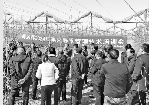
● 黄龙县果业中心组织技术专家走进田间地头

上一盘棋，共筑防火墙。为了守住绿色家底，让绿意更浓，黄龙人正在用自己的方式努力实现“山有人管、林有人护、责有人担”。