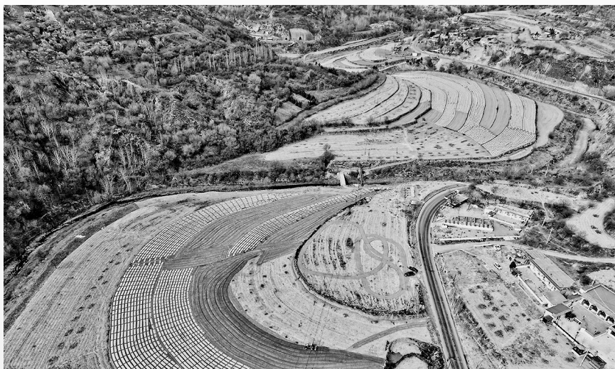
● 吴起县庙沟镇中台村大面积开始春耕

本报讯（通讯员 徐志全 樊俊虎 赵苗苗）春日风光好，田间农耕忙。连日来，吴起县田间地头随处可见农户辛勤劳作的身影，拖拉机来回穿梭，清地保墒、耙磨整压、施肥播种……一幅幅人勤春早的春耕画卷正在徐徐展开。