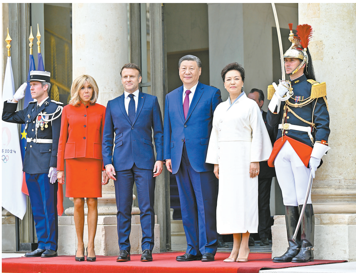
当地时间5月6日下午,国家主席习近平在巴黎爱丽舍宫同法国总统马克龙举行会谈。这是习近平和夫人彭丽媛同马克龙和夫人布丽吉特合影。

新华社巴黎5月6日电(记者 倪四义 田帆)当地时间5月6日下午,国家主席习近平在巴黎爱丽舍宫同法国总统马克龙举行会谈。 习近平指出,很高兴在中法建交60周年之际对法国进行第三次国事访问。中法关系60年珍贵历程,将使我们更好思考如何开启下一个60年。在当前世界百年变局下,双方应该坚守独立自主、相互理解、高瞻远瞩、互利共赢的建交初心,并为其注入新的时代内涵,打造新时期互信稳定、守正创新、担当作为的中法关系。双方要坚持独立自主,共同防止“新冷战”或阵营对抗;要坚持相互理解,共同促进多彩世界的和谐共处;要坚持高瞻远瞩,共同推动平等有序的世界多极化;要坚持互利共赢,共同反对“脱钩断链”。 习近平强调,中法都是文化大国,双方要加快人文交往“双向奔赴”,继续办好中法文化旅游年各项活动,积极推进文物联合保护修复工作和世界遗产地结对合作。中方欢迎更多法国朋友赴华,将对法国等12国公民短期来华的免签政策延长至2025年年底,推动未来3年法国来华留学生突破1万人、欧洲青少年来华交流规模翻一番。中方支持法方办好巴黎奥运会,将派出高水平代表团赴法参赛。中方愿同法方深化气候变化、生物多样性等领域合作,支持法方办好联合国海洋大会,鼓励两国有