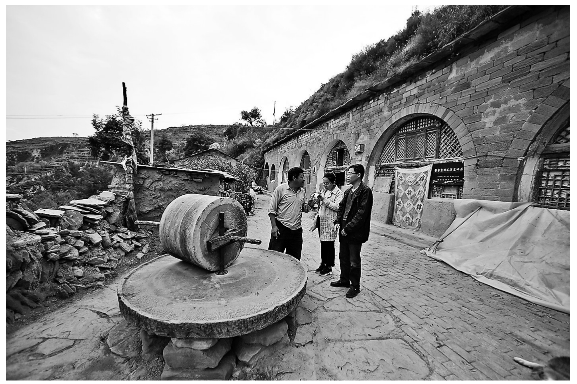
当年，毛主席就在这个碾子上通过电话指挥了著名的沙家店战役

梁家岔是佳县朱官寨镇的一个小村子，1947年8月19日至23日，毛主席在这里指挥了著名的沙家店战役，彻底改变了西北战场的局面。