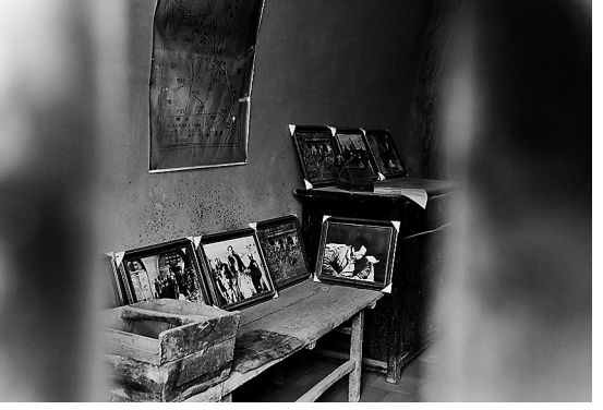
曹家庄毛主席旧居内摆放着与转战有关的资料