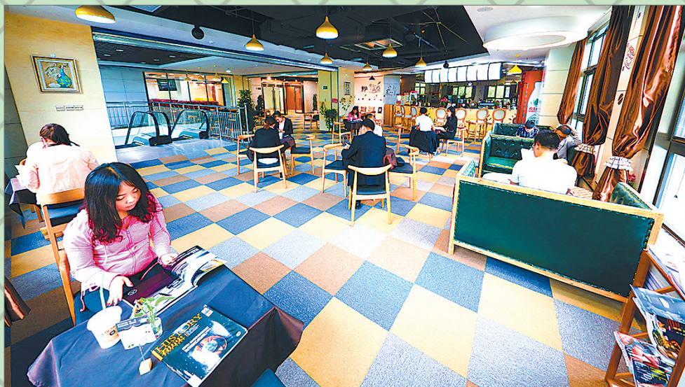
● 高新区创业服务中心科技孵化基地