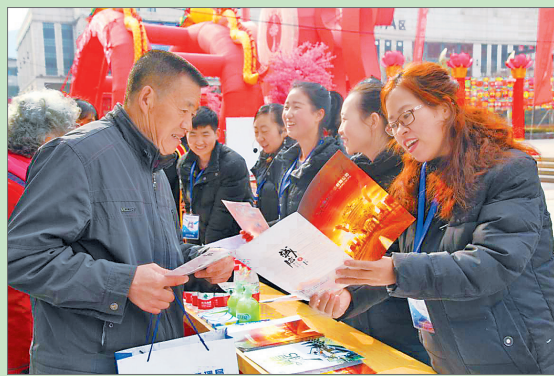
● 走上街头,宣传诚信

2017年,我市新增成长梯队企业91户(目标任务60户),其中,行业之星企业6户,成长之星企业43户,创业之星企业42户,总数达到199户。199户成长梯队企业营业收入、利润总额分别实现75.79亿元和5.74亿元,同比增速分别为9.14%、7.08%。