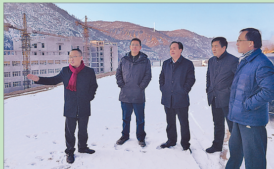
● 调研延川县工业集中区

融资难、融资贵始终是困扰我市民营企业发展的制约因素,破解中小微企业融资难问题是在中小企业局的一项重点工作。2017年,市中小企业局建立新三板后备企业资源库,征集入库企业达到44户。经过企业上市培育,2017年,我市在新三板挂牌企业达到2户,即:英雄互娱科技股份有限公司、延安一正启源科技发展有限公司;在新三板挂牌的企业达到10户;我市的延安制药股份有限公司、双丰石油技术股份有限公司、洛川县美域高生物科技有限责任公司3家企业已与证券公司签订上市辅导协议,全面加快上市进程。2017年,积极探索建立政府部门、第三方征信机构、商业银行合作新模式,开展“3+1”融资工程,促成中小微企业达成贷款意向8000万元,达到“政府搭台、银企唱戏、合作共赢”的目的。