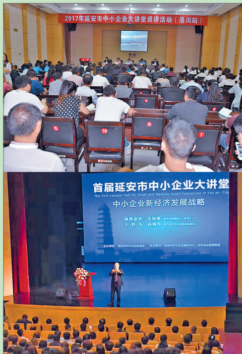
● 中小企业大讲堂巡讲