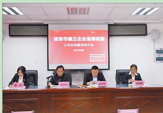
● 建立企业信用档案示范企业授牌大会

2017年,延安市中小企业系统深入贯彻落实中、省、市关于支持小微企业发展的政策措施,大力实施中小企业发展工程,突出工作重点,真抓实干,追赶超越,切实增强中小企业的发展动力和活力,中小企业及县域工业集中区得到快速发展。