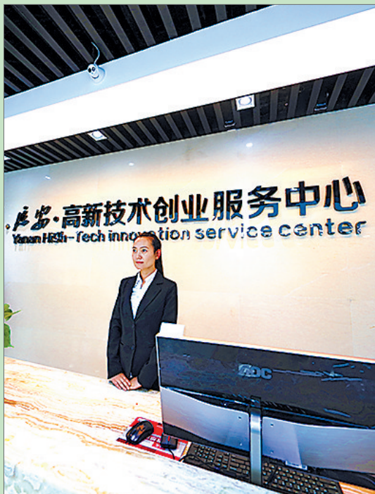
● 高新区创业服务中心