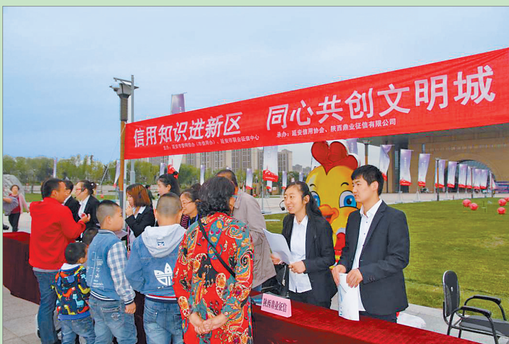
● 信用知识进新区,同心共创文明城