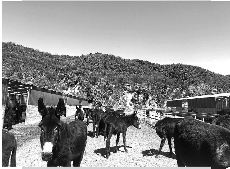
● 秦之源生态畜牧合作社的养驴厂