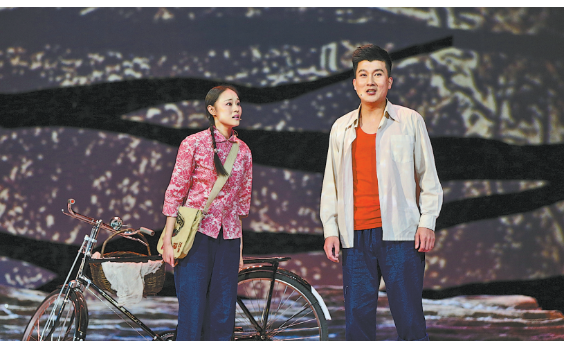
● 2016年10月,由延安演艺集团编排的话剧《人生》在我市成功演出,反响热烈。