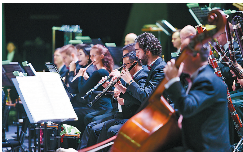
● 2019年1月1日,卡塔尔爱乐乐团《一带一路新年音乐会》在我市新城区延安大剧院举行。