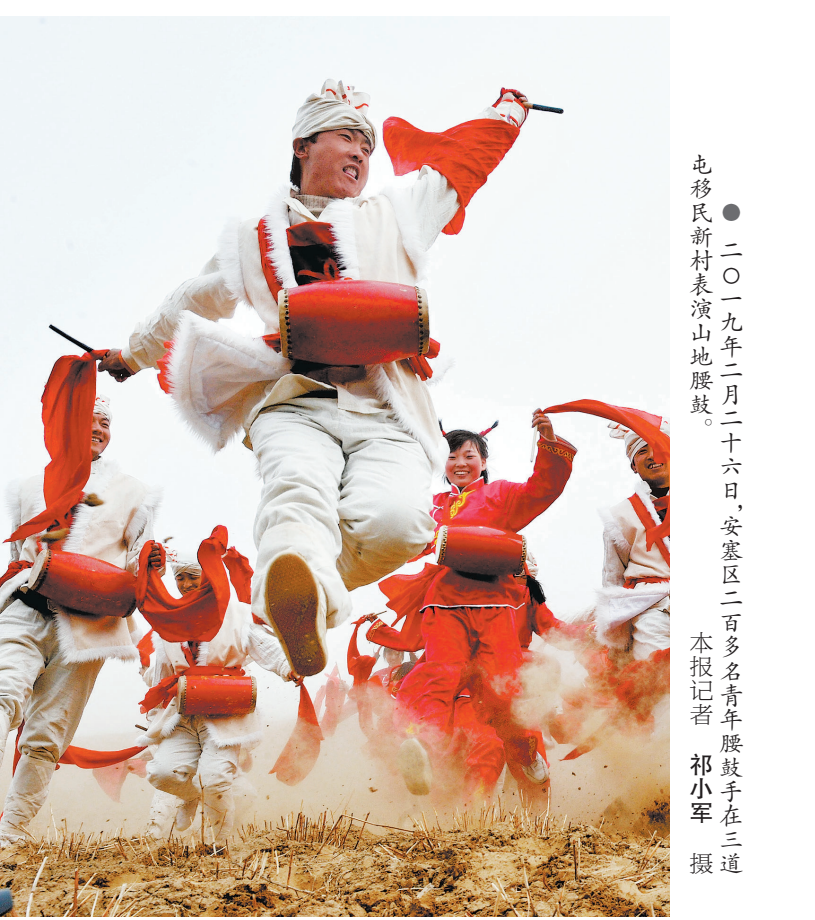
● 2019年2月26日,安塞区二百多名青年腰鼓手在三道沟村表演陕北山秧鼓。