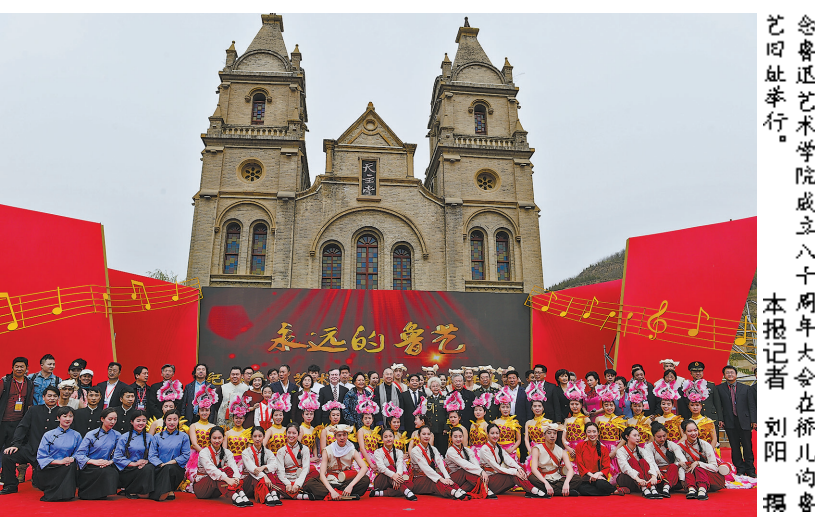
● 2018年四月十日,水运的鲁艺纪念馆成立八十年大会在桥儿沟举行。