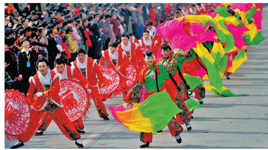
● 长岭子的女子秧歌队在延安市第三十届正月十五秧歌展演活动演出。