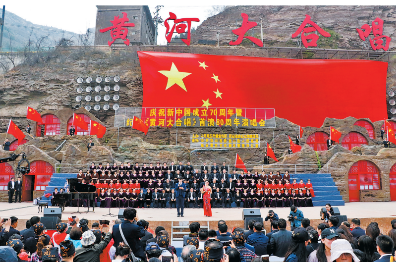
● 2019年4月9日,庆祝新中国成立70周年暨纪念《黄河大合唱》首演80周年演唱会在黄河壶口瀑布举行。