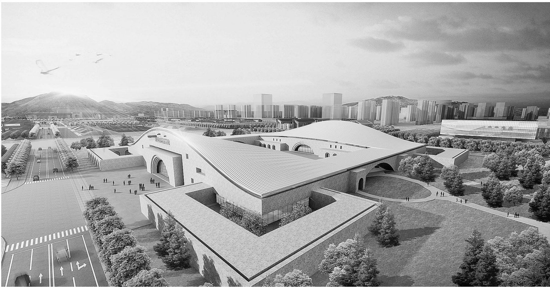
● 延安博物馆鸟瞰图(效果图)