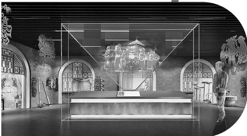
● 风情延安展馆效果图

6月29日上午，在新区延安大剧院附近，2018年5月开始动工的延安博物馆建设项目主体上贴着的大幅红底黄字“封顶大吉”，宣布该博物馆的建设进度取得了阶段性成效。在彩旗和钢架围挡下，这座