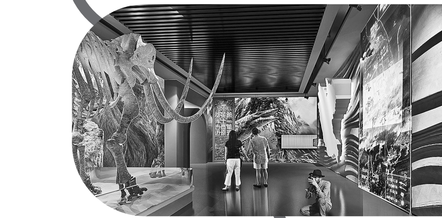
● 地理延安展馆效果图