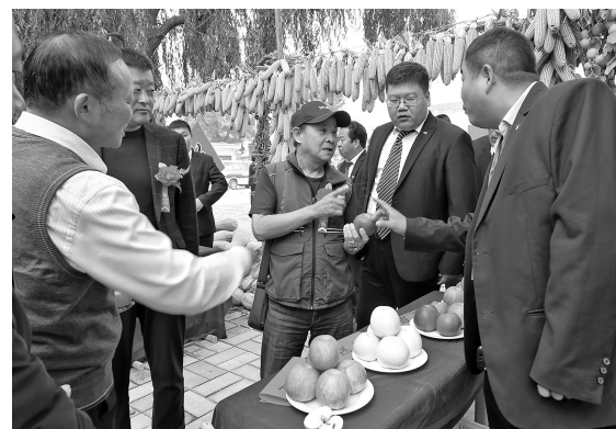
● 展示的农特产品吸引了不少人关注