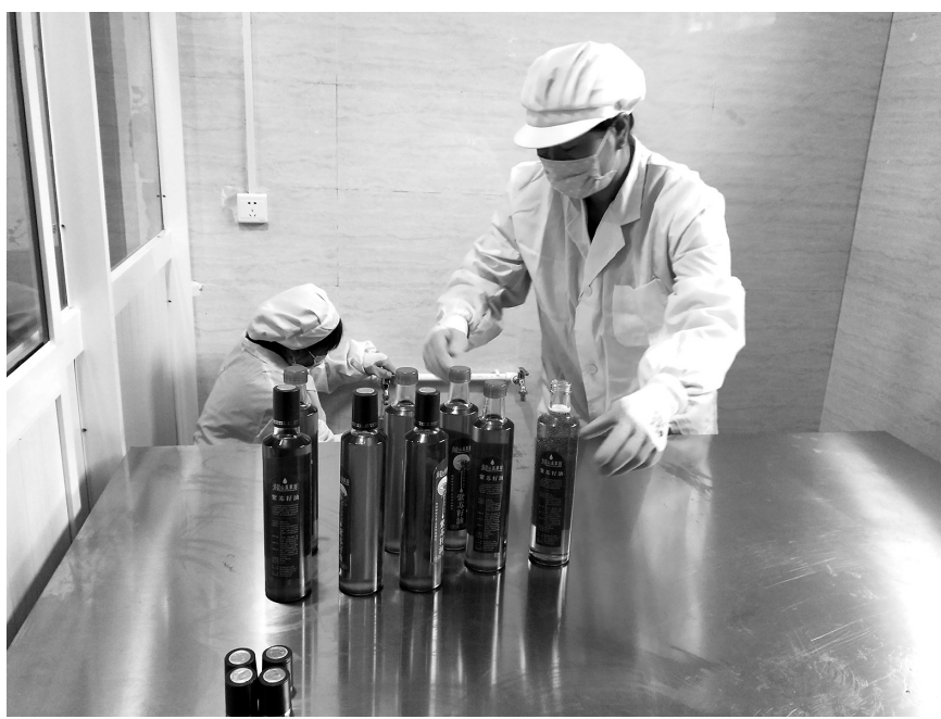
● 工人们正在加工包装紫苏油产品

下一步,该镇还将利用3年时间,打造一个5000亩的中药材种植基地,让这项产业成为继“瓦子街高山冷凉菜”之后的又一项群众脱贫致富产业。届时,瓦子街镇眼目所及之处,花开烂漫、药草飘香,花卉中药材基地可观、可加工、可卖钱,不仅乡村旅游锦上添花,群众腰包还有可观收入入账。