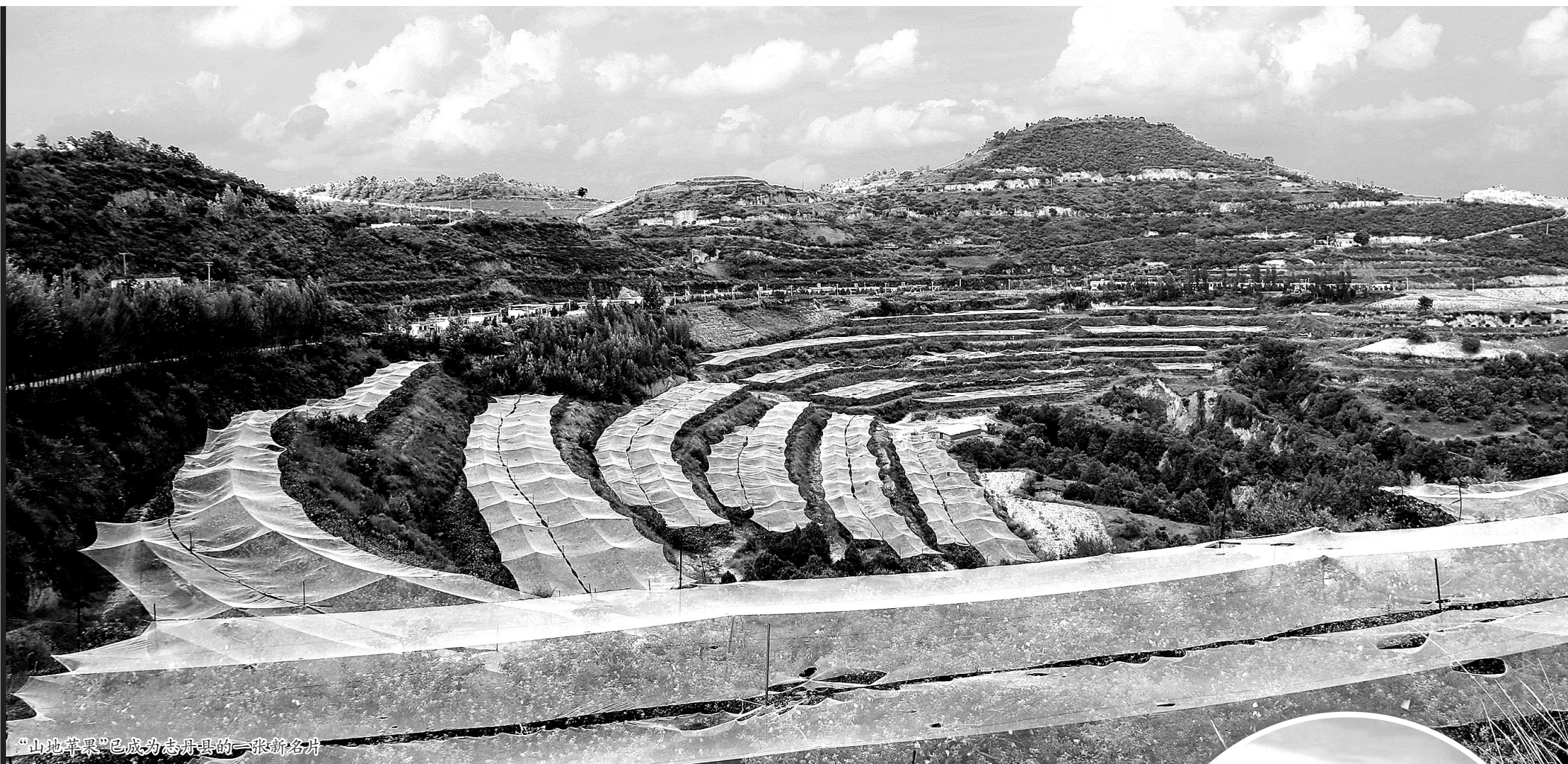
“山地苹果”已成为志丹县的一张新名片