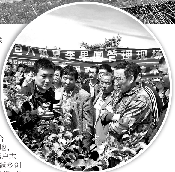
● 现场对群众进行产业技术培训

先锋带动。动员3000余人返乡创业,引进龙头企业12家,培育农民专业合作社354家、家庭农场2008个、产业大户3589户,建起陕果集团2万亩苹果、绿葆农业8000亩黄芪、北京惠农3000亩油用牡丹等15个“三变”改革基地,引进新希望和东方希望两大龙头企业落户志丹,催生出一大批产业能人、种植大户、返乡创业者,在乡村的沃土上挥洒汗水、收获梦想,带动老乡们告别贫困、走向富裕。