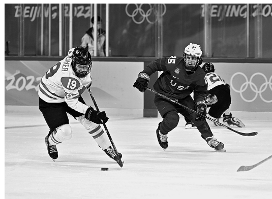
2月8日，美国队球员亚历克斯·卡彭特（右）与加拿大队球员布里安娜·詹纳在比赛中拼抢。

当日，在五棵松体育中心举行的北京2022年冬奥会女子冰球小组赛中，加拿大队以4比2战胜美国队。